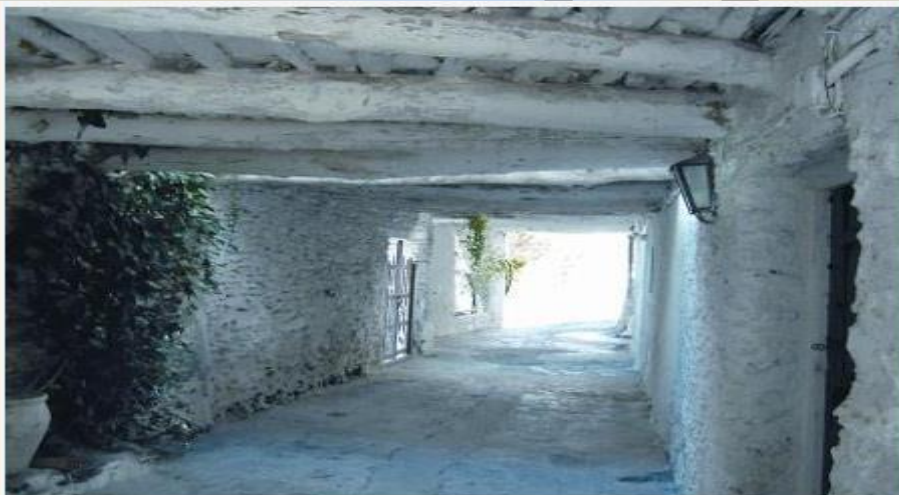
Ejemplo de tíno en La Alpujarra.

el nombre no deja de ser peculiar y poco conocido. Pero sus connotaciones son arquitectónicas, hace referencia a una figura arquitectónica que enlaza núcleos de viviendas, o de actividad ganadera, convirtiéndose en un pasillo de refugio o paso, y que sirve de comunicación semi-privada-pública, entre estos dos núcleos, en el término agrícola es la sección que enlaza el granero con el habitáculo de los animales.