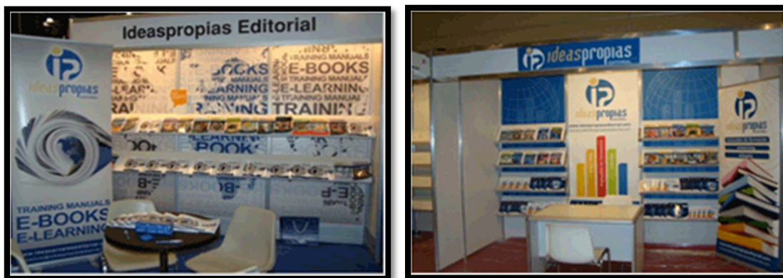
Stands en Ferias del Libro

Ideaspropias ha participado en la Feria Internacional del Libro de Bogotá de la mano de Ediciones de la U, importante editorial colombiana.