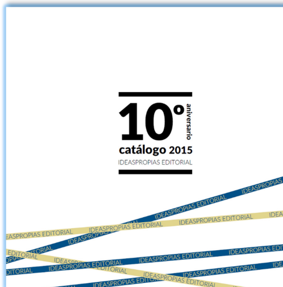
Portada del Catálogo del 2015

Nos adaptamos a las exigencias de nuestro entorno con responsabilidad. Por ello, una parte destacada de nuestro catálogo formativo se desarrolla de acuerdo con los índices aprobados en el Catálogo Nacional de Cualificaciones Profesionales del Ministerio de Educación y en los certificados de profesionalidad definidos por el Ministerio de Trabajo e Inmigración.