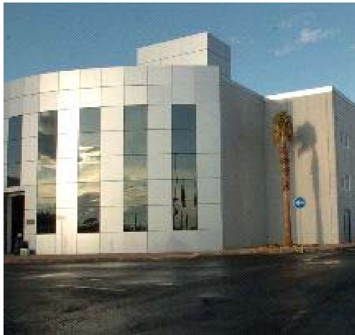
Centro Municipal de Formación Ocupacional e Inicial de Empleo

El Centro Municipal de Formación e Iniciativas de Empleo está ubicado sobre una parcela de más de 5.000 m 2 , junto a la Ciudad deportiva de "La Torrecilla". Esta infraestructura está destinada al empleo y al desarrollo local, tiene una superficie total construida de 2.300 m 2 . Cuenta, además de los espacios comunes, con 8 talleres destinados a la formación de profesiones relacionados con la construcción (electricidad, fontanería, cerrajería, carpintería, albañilería, pintura,...).