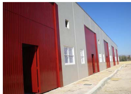
Viveros Municipales de Empresa

La adjudicación de la nave se formaliza a través de un contrato de arrendamiento temporal y la renta de alquiler asciende a 100 €, pagaderos anticipadamente los días 1 a 5 de cada mes. El horario del Vivero es: de lunes a viernes de 8.00.h de la mañana a 22.00.h de la noche y sábados de 8.00.h de la mañana a 15.00.h de la tarde. El plazo de estancia en el Vivero Municipal de Empresas “La Torrecilla” es de 2 años.