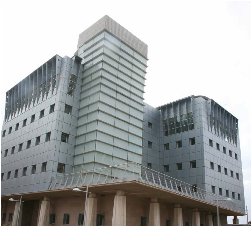
Centro de desarrollo local

Desde este centro impulsan, coordinan y planifican las acciones que se realizan en el municipio, dirigidas a la promoción del empleo y el desarrollo Local. Para ello dispone de una serie de recursos humanos, económicos, institucionales, culturales y naturales que constituyen un importante potencial y que, adecuadamente articulados y contando con la iniciativa empresarial, pueden favorecer el crecimiento socioeconómico y elevar el nivel de vida de la población